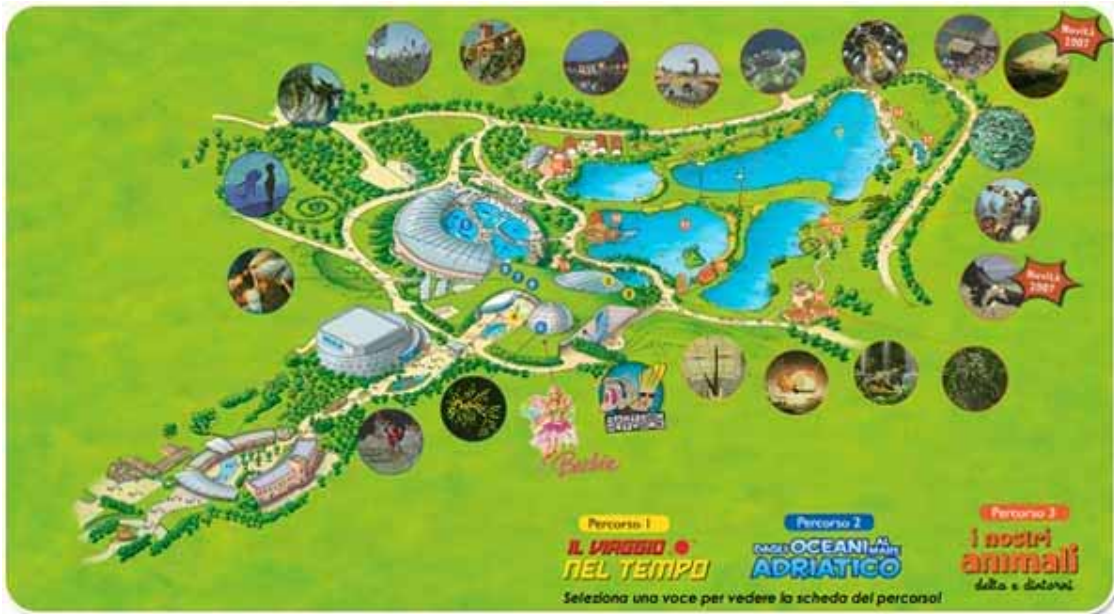
Il Parco Oltremare