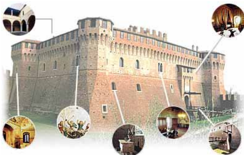
L'antica roccaforte di Gradara